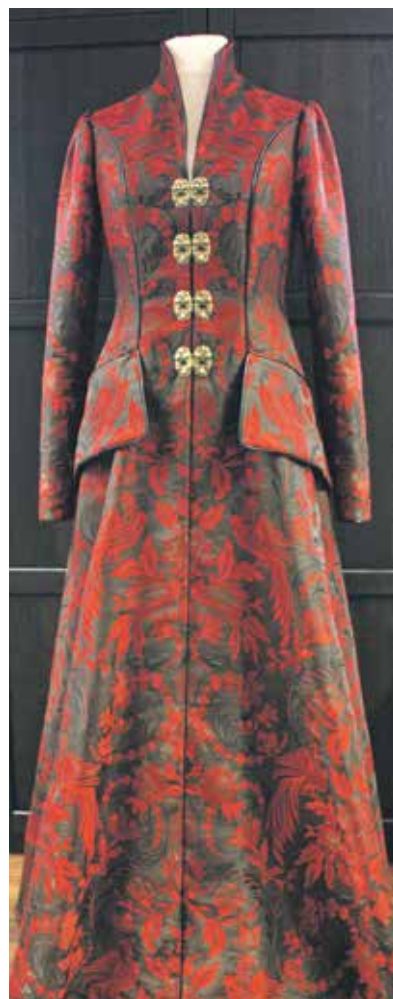
Designpreis, Kategorie Produkte, für das Atelier angemessen, Rehau: Phönix-Ensemble – Abendmantel und Unterbrust-Korsett .