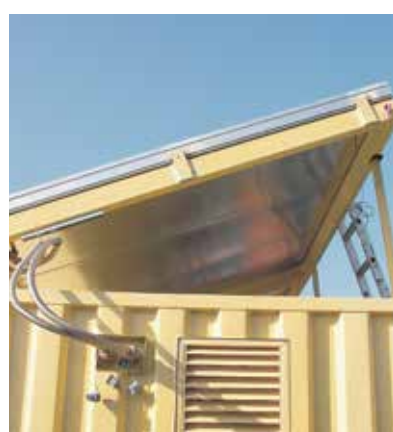
Erfinderpreis, Kategorie Produkte, für die Wiegel Gebäudetechnik GmbH, Kulmbach: mobile, solare Warmwasserbereitung .