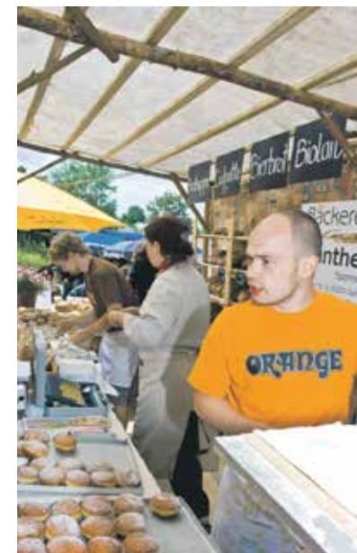
Designpreis, Kategorie innovative Geschäftsideen, für die Bäckerei Günther, Sparneck: Sparnecker Brot- und Bäckermarkt .