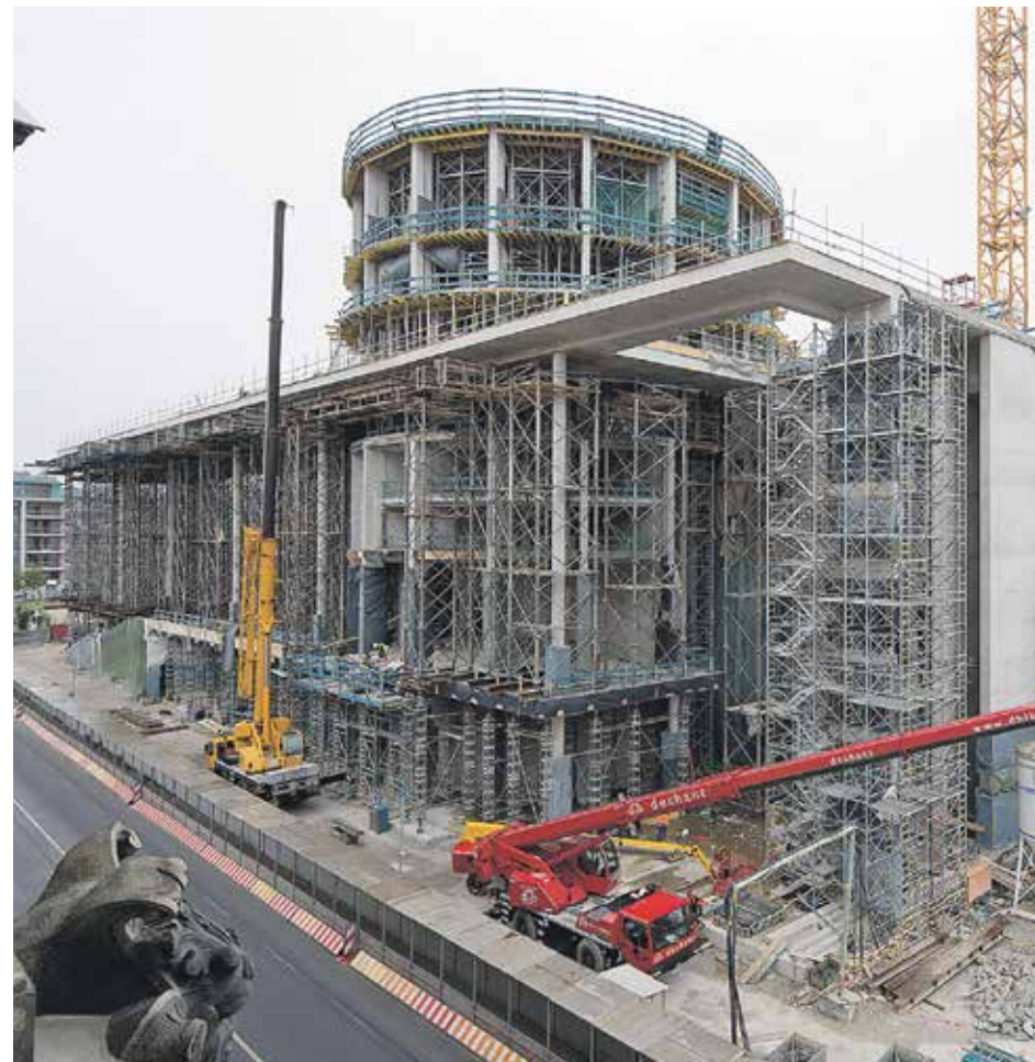
Design- und Erfinderpreis, Kategorie Objekte, für die dechant hoch- und ingenieurbau gmbh, Weismain: Erweiterung des Marie-Elisabeth-Lüders-Hauses .