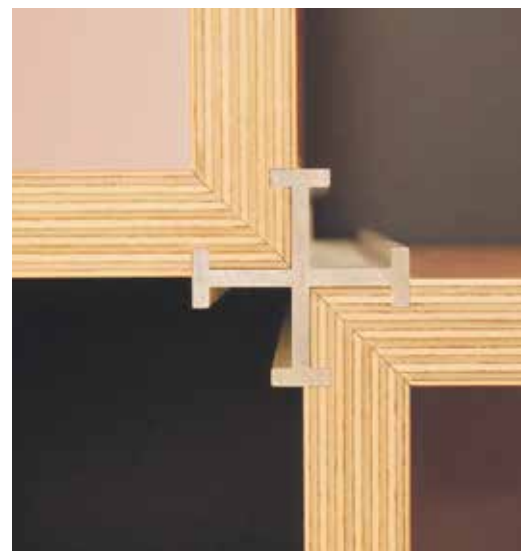
Design- und Erfinderpreis, Kategorie Produkte, für die Thomas Schuhmann Innenausbau GmbH, Scheßlitz: Möbelsystem Eichenfrau System 500 .