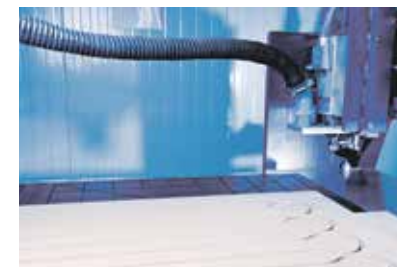
Erfinderpreis, Kategorie Objekte, für die KRAUTHÖFERthermoflair GmbH, Kirchenlamitz: Flächenheizsystem KRAUTHÖFERthermoflair .