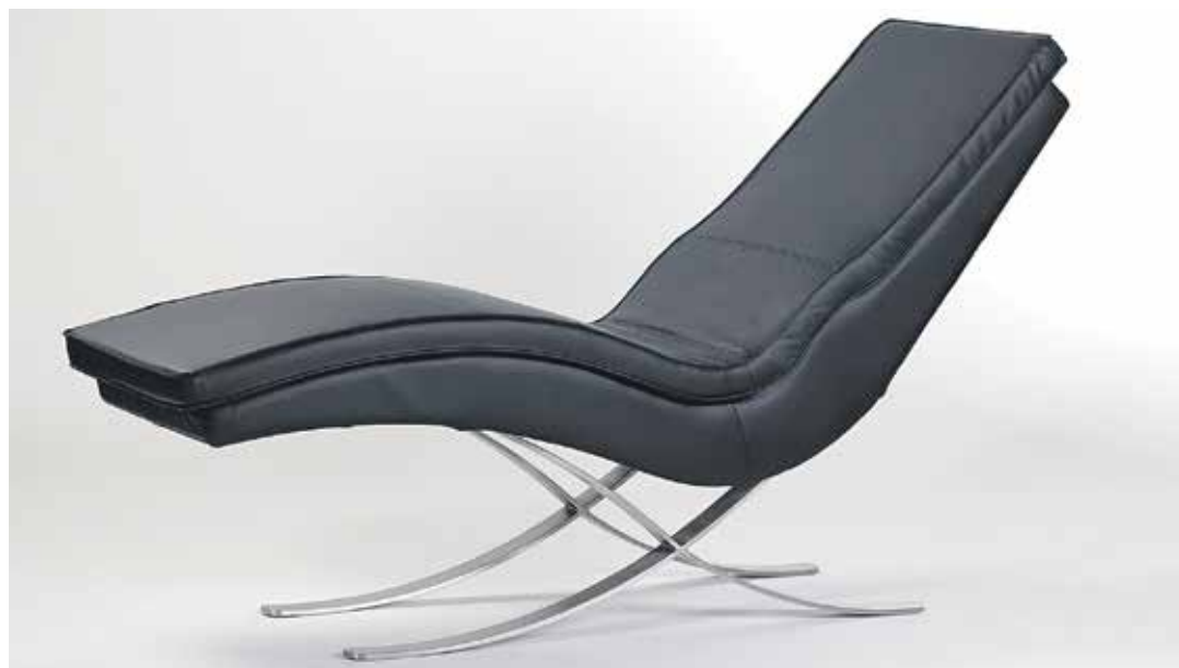
Design- und Erfinderpreis, Kategorie Produkte, für Göckel-Design e.K., Dörfles-Esbach: THERA 3D Massageliege .