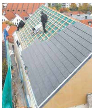
Erfinderpreis, Kategorie Objekte, für die Schwender Energie- und Gebäudetechnik GmbH & Co. KG, Thurnau: energieeffizientes Heizen in einem Wohnhaus in einem denkmalgeschützten Viertel .