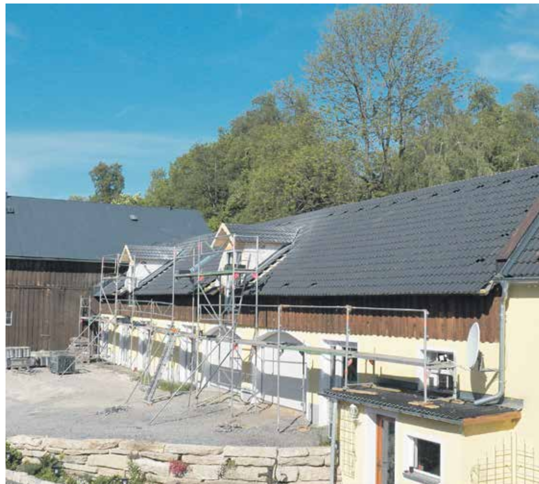
Sonderpreis, Kategorie Objekte, für die Firma Power-Profi, Münchberg: Energiemodernisierung und Sanierung eines Gutshofs .