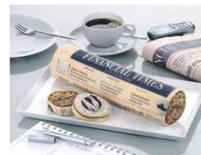
Designpreis, Kategorie innovative Geschäftsideen, für die Fickenschers Backhaus GmbH, Münchberg: logolini .